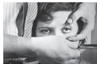
Brumel, Den Andalusiske hund, 1928

Samtidig udfordrer filmene også elevernes forståelse af den verden, der omgiver dem. De møder ikke kun genkendelse, men også indsigt og erkendelse. Filmene stiller en række etiske udfordringer, der er med til at styrke deres personlige kompetencer. I alle filmene er der nogen, der har noget på spil.